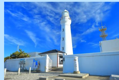
(灯台参観料 大人300円)

銚子のシンボル 犬吠埼灯台は 世界灯台100選に選ばれた、のぼれる灯台。 付近には、灯台資料館やお土産店 「犬吠テラステラス」でショッピングも。